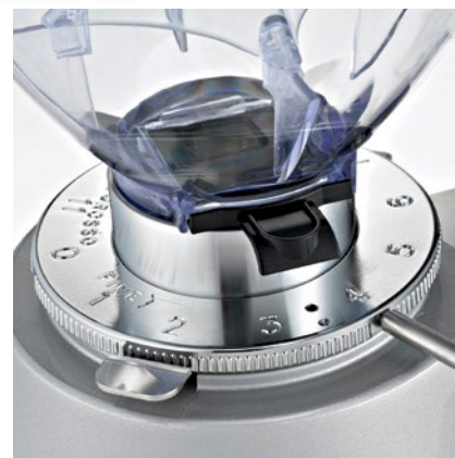
regolatore macinatura micrometrica micrometric grinding adjustment