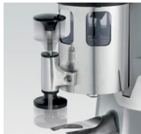
pressino telescopico / telescopic tamper