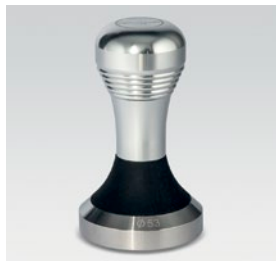
pressino in metallo / metallic tamper