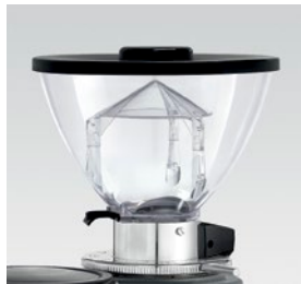
campana 500g / coffee bean hopper 500g