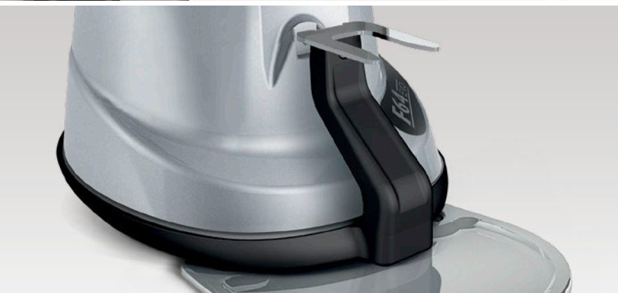
dispositivo per la taratura e la pesatura della dose di caffè device used to calibrate and weigh the dose of coffee

Thanks to the innovative patent of the XGi coffee grinder, the quantity of coffee dispensed, calculated in grams and set ONLY ONCE , will not change, guaranteeing precise doses and avoiding any waste.