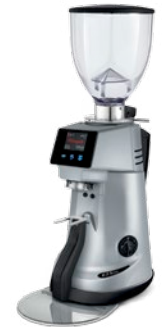
F71 KE XGi pag. 18