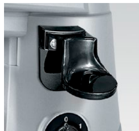
pressino laterale destro o sinistro right or left side tamper