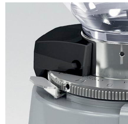
blocco ghiera - blocco campana ring nut lock - coffee bean hopper lock