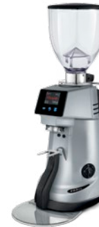
F63 KE XGi pag. 17