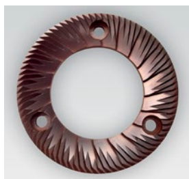
macine red speed / red speed blades