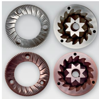
macine piane, coniche e red speed lunga durata flat, conical and red speed long duration blades